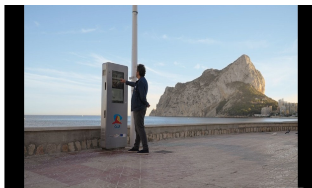
spot TV provincial

Además, se ha llevado a cabo una campaña publicitaria en televisión provincial con sobreimpresiones, cuñas de radio regional y a través de Facebook e Instagram en los que se ha difundido un vídeo en formato reel.